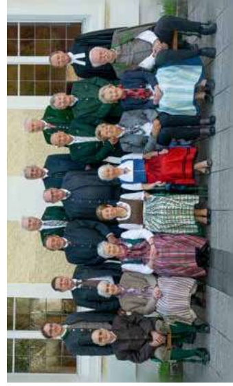
Eiserne Konfirmation 65 Jahre