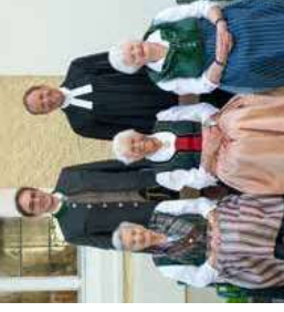
Eichen Konfirmation 80 Jahre