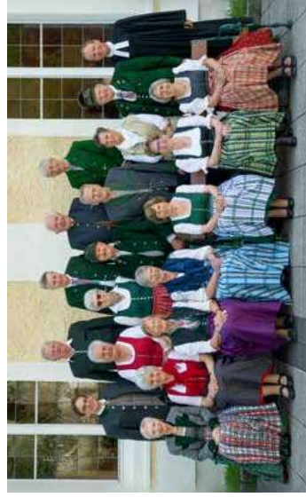
Diamantene Konfirmation 60 Jahre