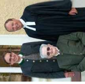
Engel Konfirmation 85 Jahre