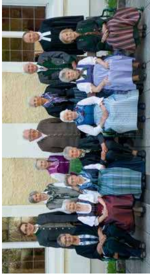
Gnaden Konfirmation 70 Jahre

Fortsetzung von Seite 9 - Jubiläumskonfirmation Bad Goisern