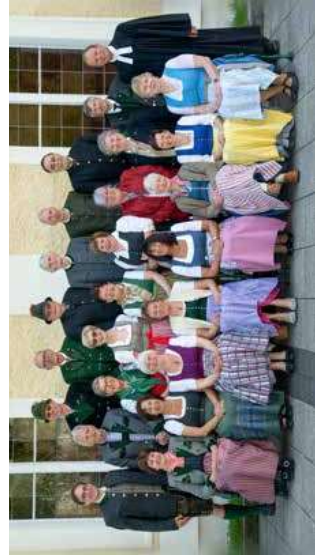
Goldene Konfirmation 50 Jahre